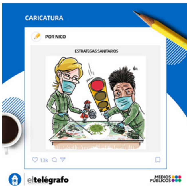
Figura 2. Estrategias sanitarias.