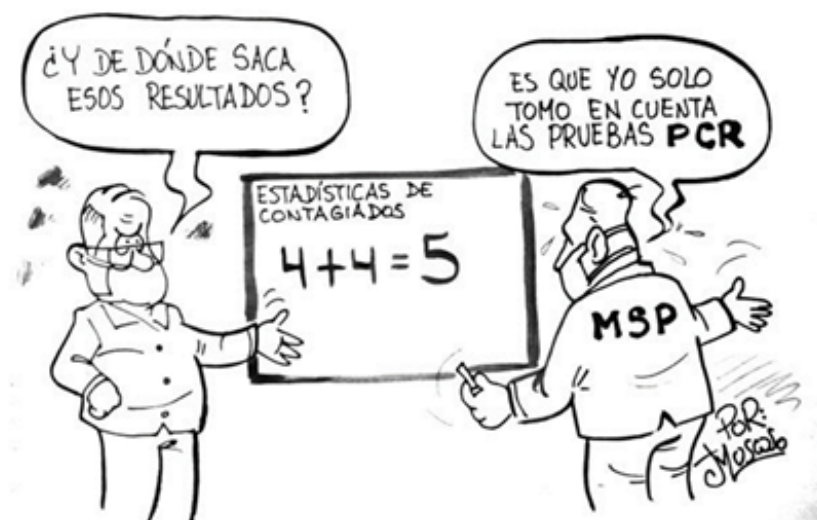
Figura 3. Estadísticas de contagiados