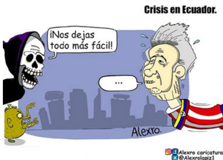
Figura 1. Crisis en Ecuador