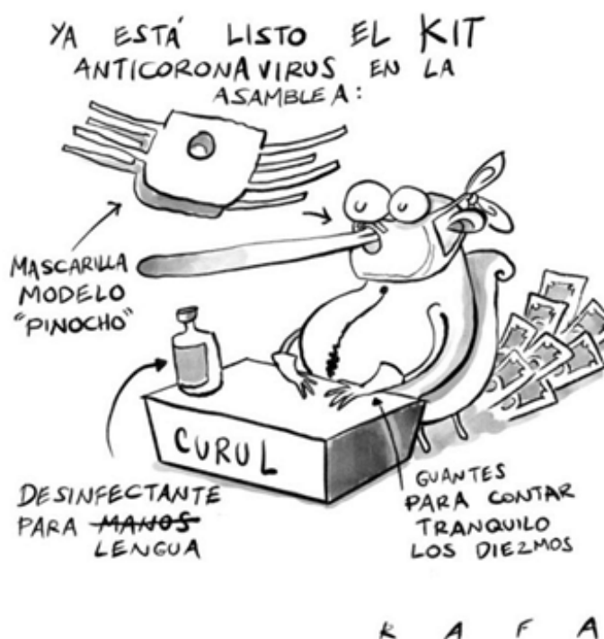
Figura 4. Anticoronavirus en la Asamblea